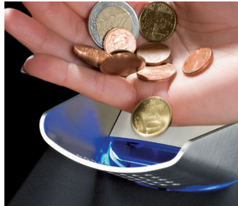
Acepta y verifica hasta 4 monedas por segundo