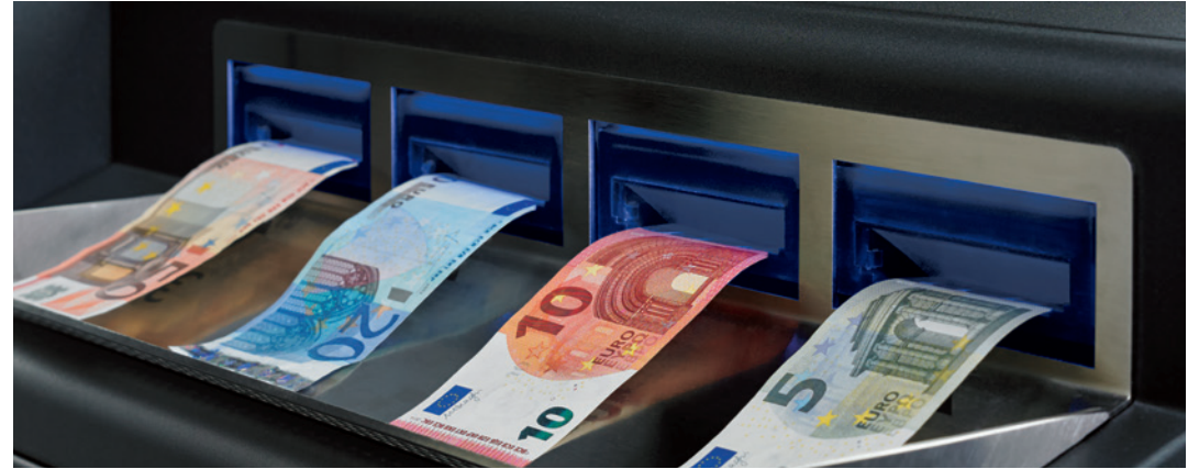
Paga hasta 4 billetes simultáneamente