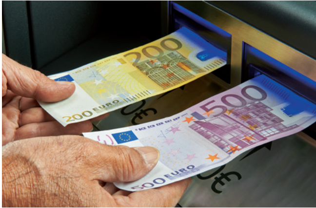
Acepta y verifica varios billetes simultáneamente