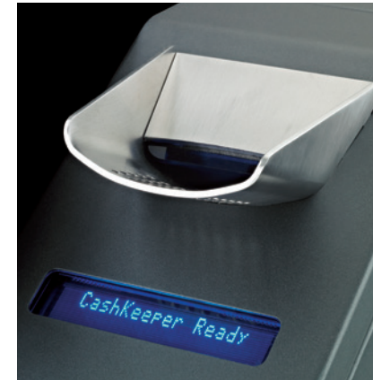
Visor integrado de alta luminosidad